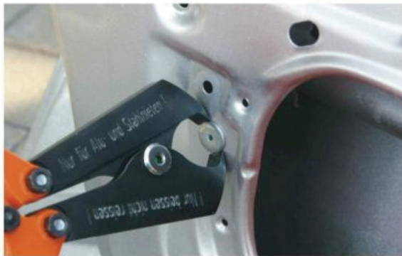
1. Nietkopf-Cutter ansetzen