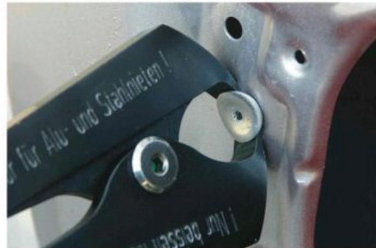
2. Nietkopf unterfassen