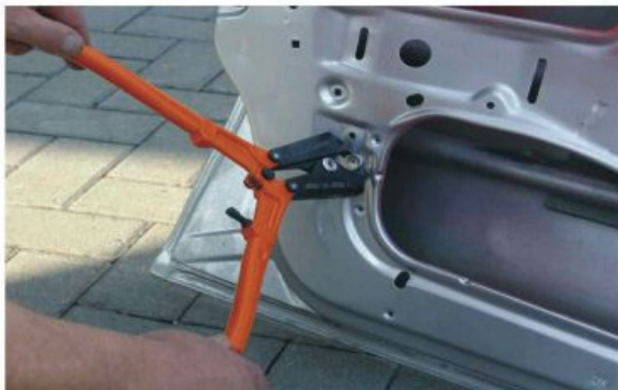
3. Nietkopf abschneiden