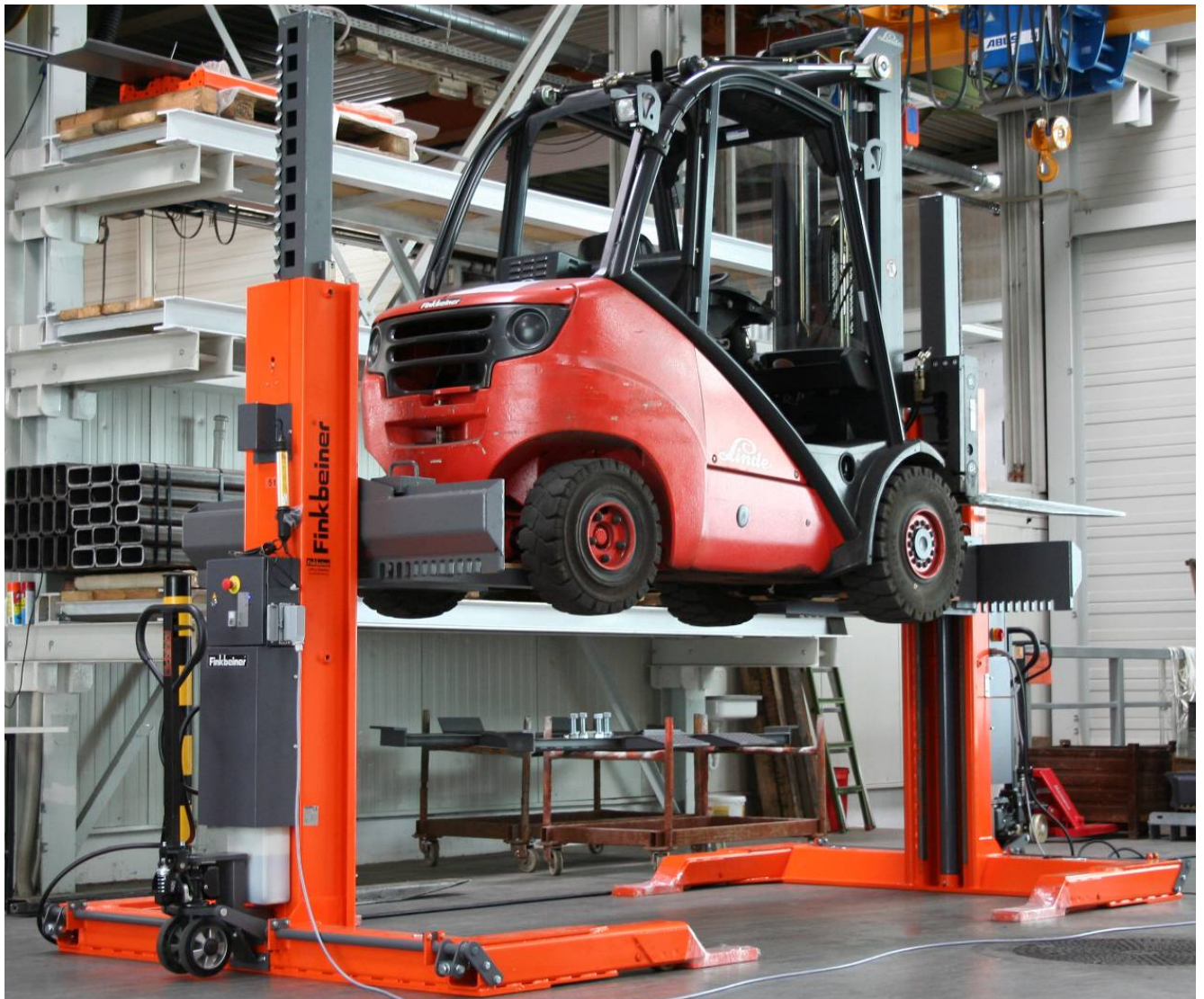
Hebeanlage GAB705-2 (Tragkraft 2 x 5 t = 10 t)