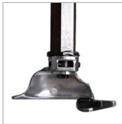
Montage-/Demontagekopf mit Kunststoffschutz