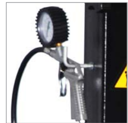
Manometer für Reifenfüller