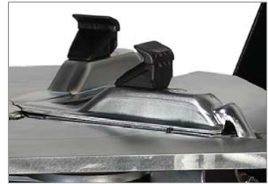
Erprobte, getestete und bewährte Spannklaue mit Kunststoffschutz