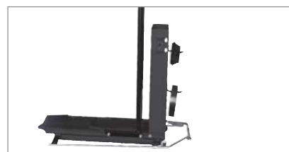
Chariot élévateur pneumatique (réf. N° 4028401)