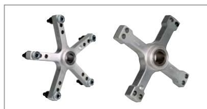
Jeu de serrage professionnel pour roues centrées par les boulons, de 8 x 285 mm / 8 x 275 mm / 10 x 225 mm / 10 x 335 mm / 10 x 285 mm, avec 4 branches/étoile 5 branches et 5 écrous (réf. N° 4028764)