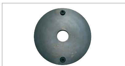
Entretoise pour roues de fourgon (réf. N° C30616)

Pour roues des camions et fourgons avec diamètre jante de 170 / 184,15 / 205 / 222,25 / 245 mm