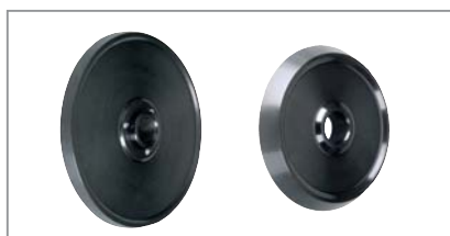
Jeu de serrage standard avec 2 cônes PL (198–225 mm / 270–286,5 mm) (réf. N° 4028713)