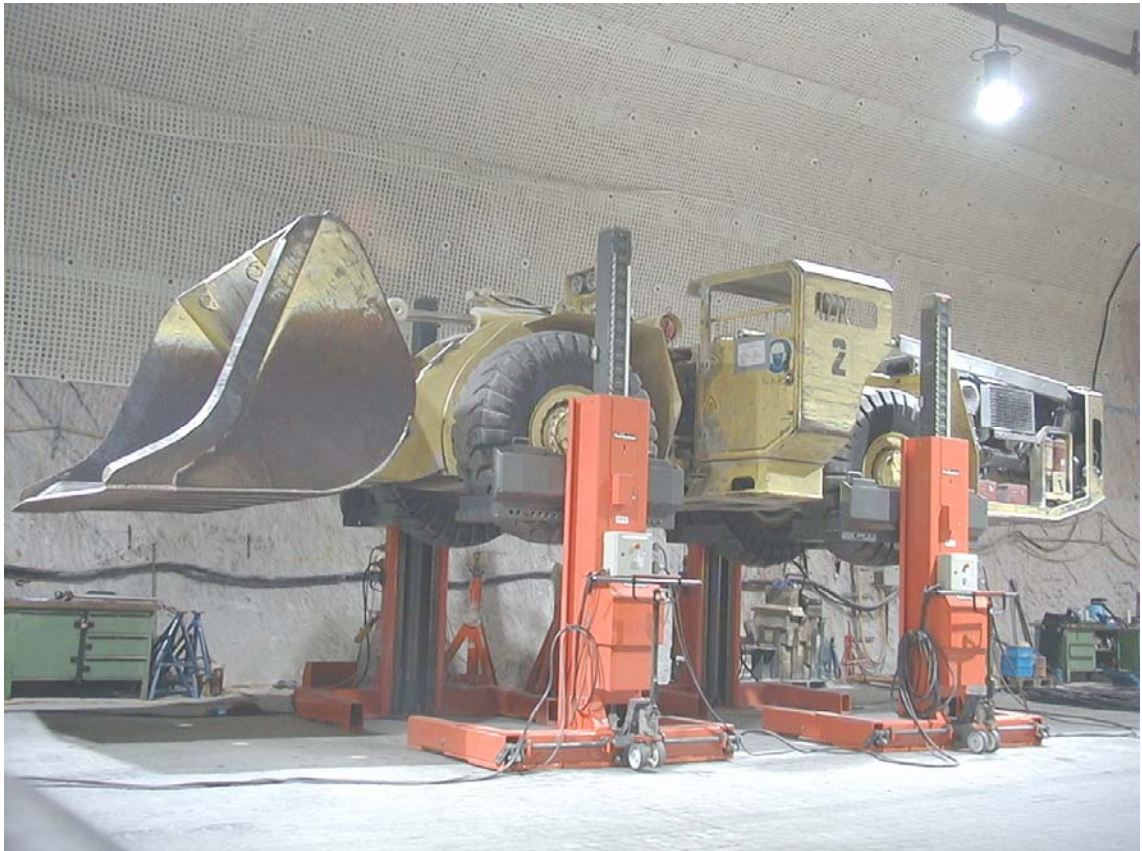
Mobile Hebeanlage EHB715V18K-4, Tragkraft 4 x 15 t = 60 t