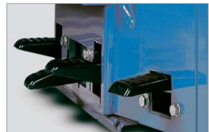
Das pedalgesteuerte Spannklaue-Füllsystem macht die Arbeit noch leichter.