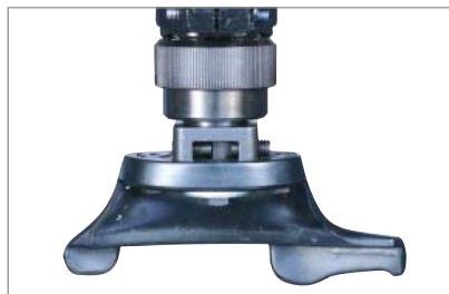
Optionaler Wechselmontagekopf mit Schnellkupplung.