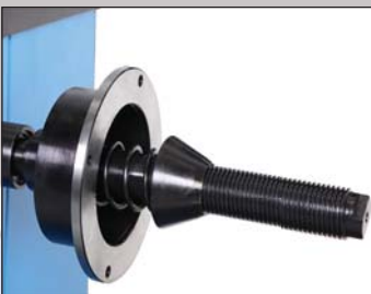
Arbre de diamètre 40 mm pour une bonne stabilité et le bon équilibrage de roues lourdes