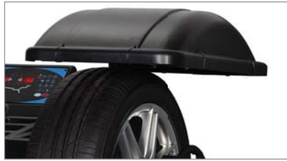
Carter de roue compris