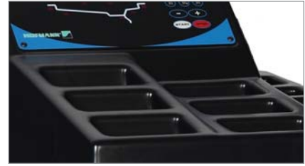
10 compartiments pour le rangement des masses, avec panneau d'affichage intégré