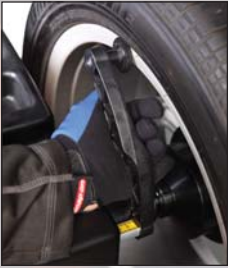
Pige de mesure du déport ergonomique