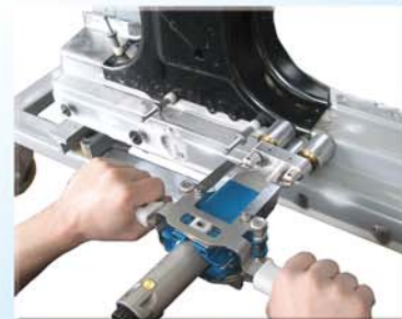
Leichtmetallgehäuse mit ergonomischen Griffen und Vorschubsystem