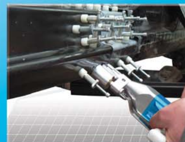
Kraftreduziertes Bohren - auch bei schwierigen Werkzeugpositionen