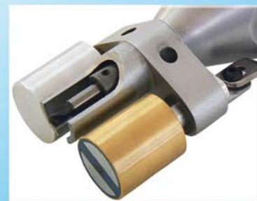
Zentral angeordnete Aufnahme für die Spezialbohrer