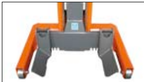
Раздвигаемые вилки каретки.