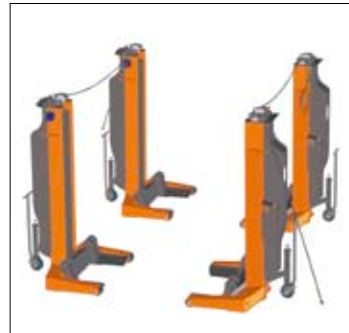
Простая система подключения кабеля зарядки, как от каждой колонны к розеткам, так и последовательно, с одним подключением.