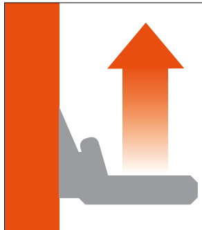
Постепенный набор скорости движения. Бесступенчатое движение.