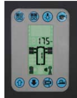
Комфорт управления и безопасность благодаря наличию дисплея.