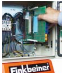
Steuerung an jedem Hebebock, steckbare Platinen