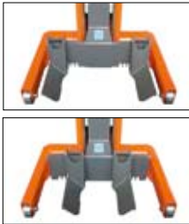
Verstellbare Radgabeln, keine Adapter erforderlich