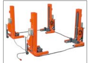
Kurze Kabelverbindungen um das Fahrzeug herum