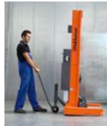
Leicht von einer Person verfahrbar