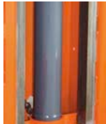
Hydraulikzylinder, geschützt und robust