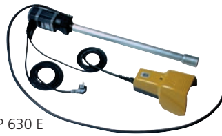
KRP 630 E

230 V, 50 Hz, 18 kW, Fördermenge 3-5 Ltr./min. Inkl. Anschlußkabel mit Schukostecker, Thermoschutz und Fußschalter.