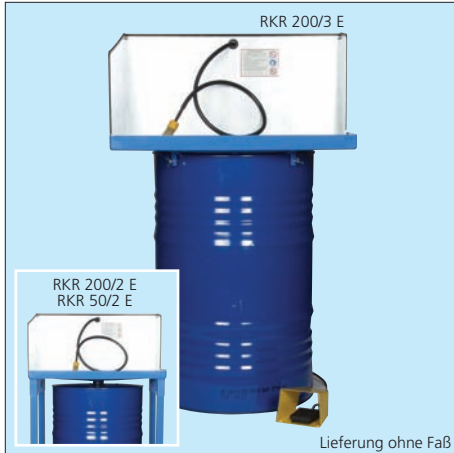
Lieferung ohne Faß

Die Reinigungsflüssigkeit wird mittels einer selbstansaugenden Faßpumpe durch den Spezial-Pinsel direkt auf das Reinigungsgut gepumpt und fließt durch eine Öffnung in der Wanne über einen Schlauch ins Faß zurück. Dort setzt sich der gelöste Schmutz am Boden ab, während die Pumpe im oberen Bereich des Fasses frische Reinigungsflüssigkeit ansaugt.