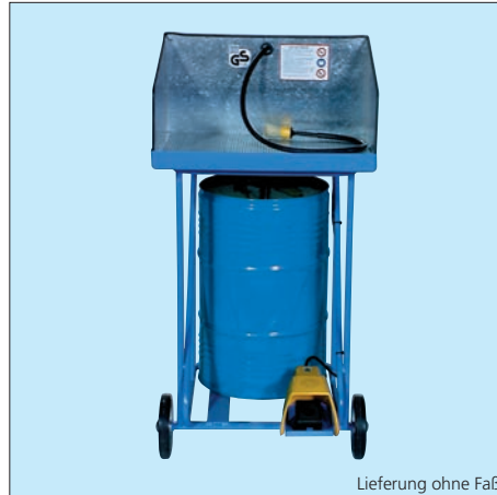
Lieferung ohne Faß