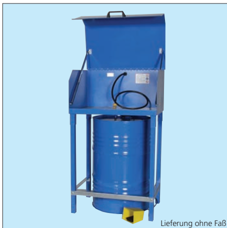
Lieferung ohne Faß